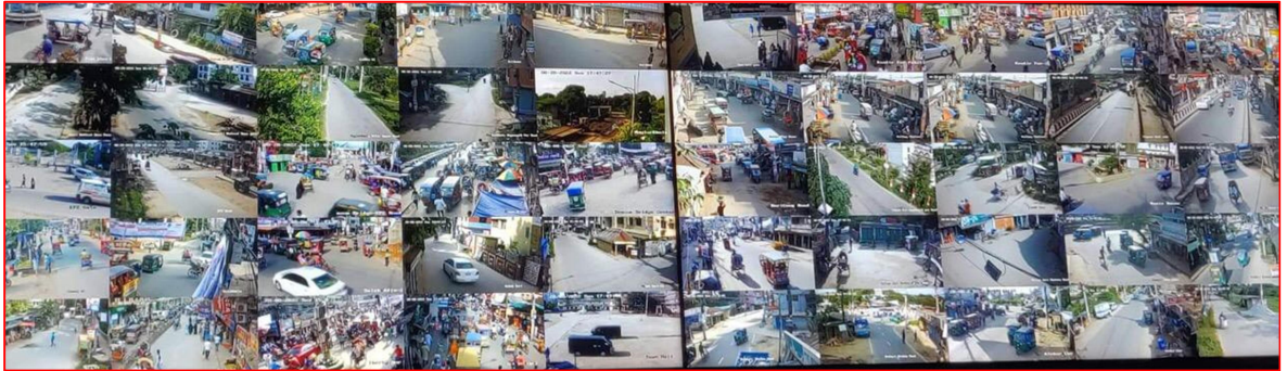
কুমিল্লা মহানগর এলাকার জননিরাপত্তার জন্য সিসি ক্যামেরা স্থাপন