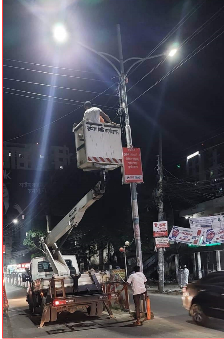
বিম লিফটারের মাধ্যমে সড়ক বাতি স্থাপন ও মেরামত কাজ