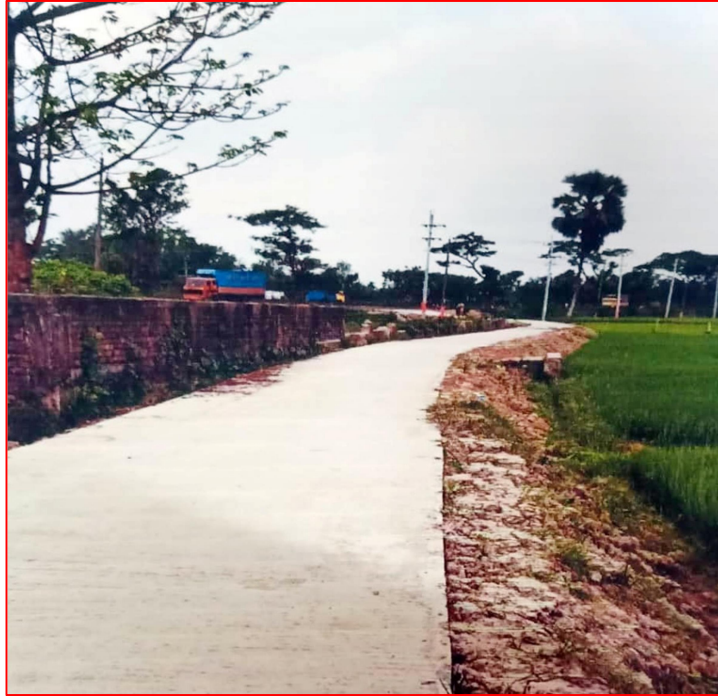
আরসিসি রাস্তা নির্মাণ