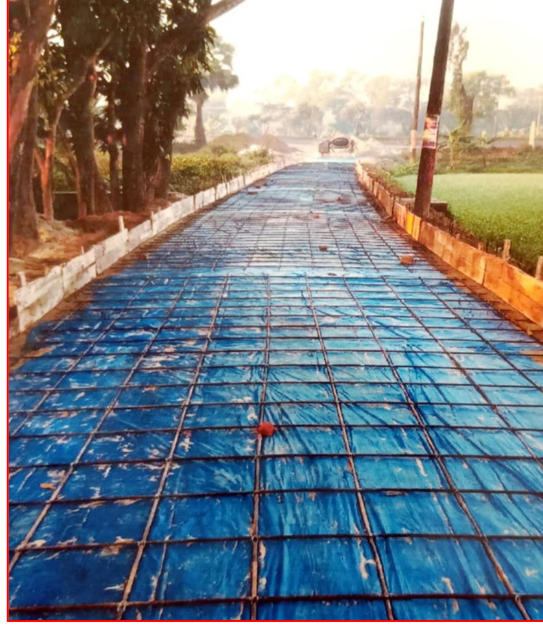
আরসিসি রাস্তা (নির্মাণাধীন)