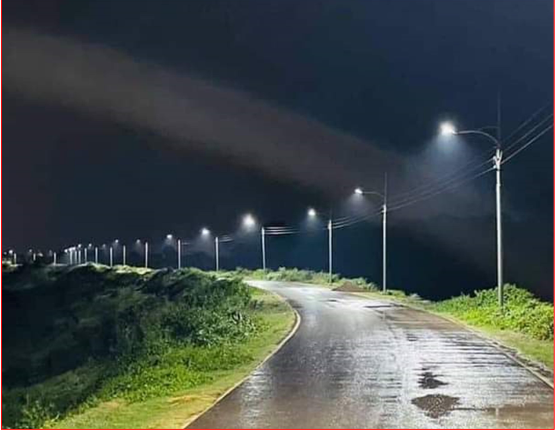
গোমতী বাইপাস সড়কে স্ট্রিট লাইট স্থাপন