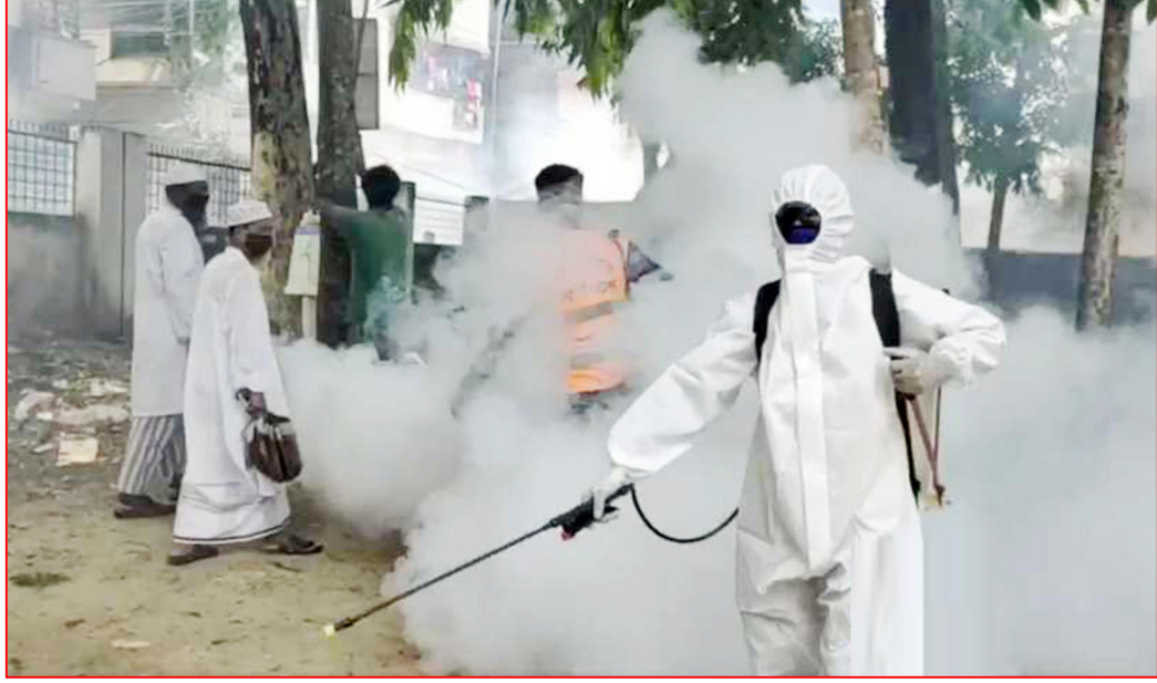
মশক নিধন কার্যক্রম