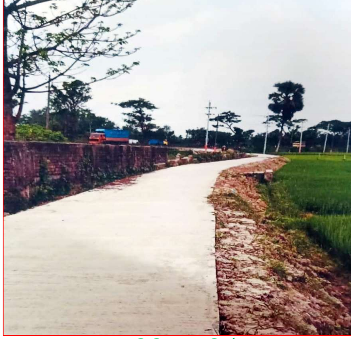
আরসিসি রাস্তা নির্মাণ