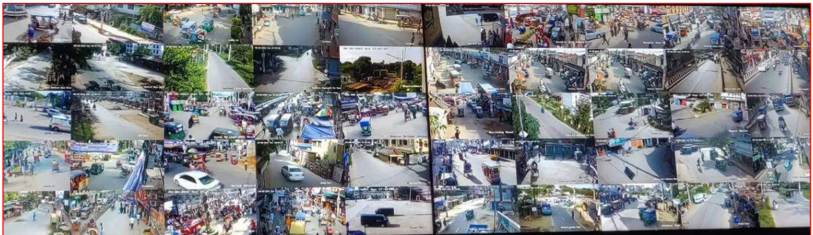
কুমিল্লা মহানগর এলাকার জননিরাপত্তার জন্য সিসি ক্যামেরা স্থাপন