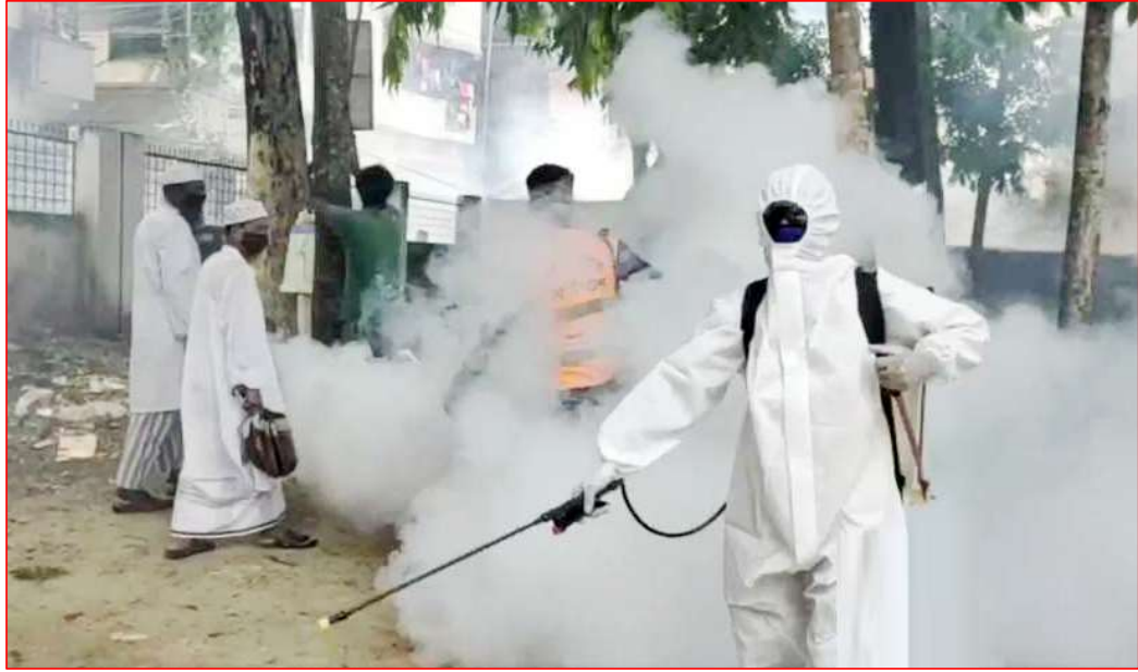
মশক নিধন কার্যক্রম