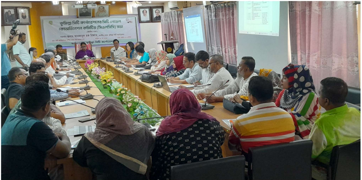
সিটি লেভেল কোঅর্ডিনেশন কমিটির সভা