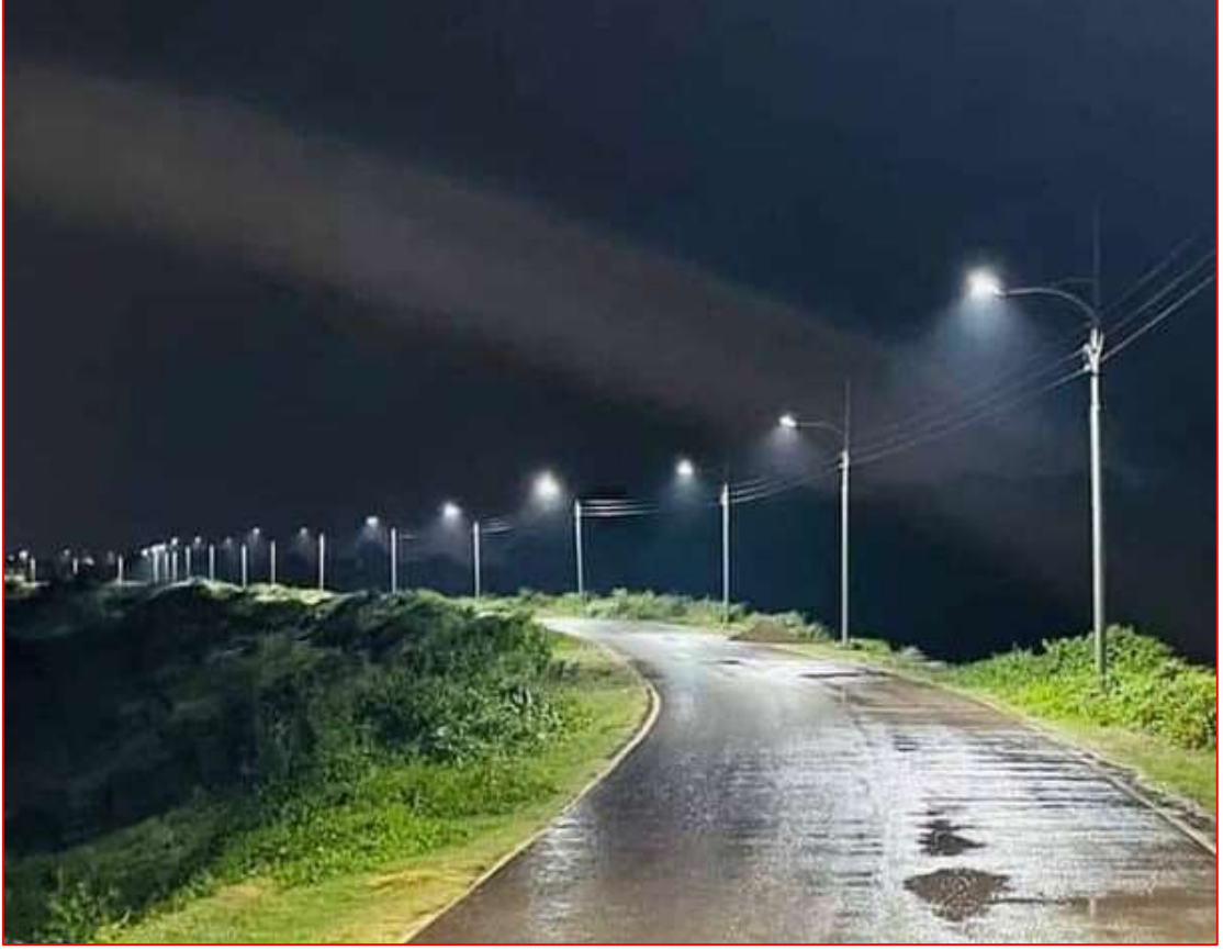
গোমতী বাইপাস সড়কে স্ট্রিট লাইট স্থাপন