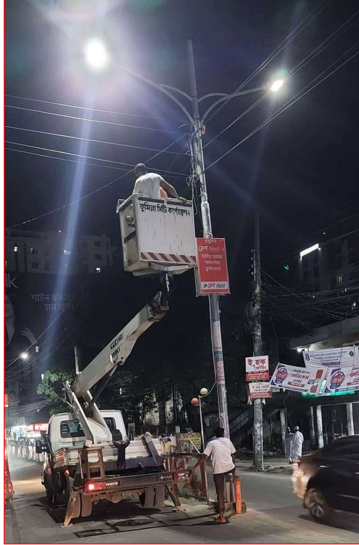
বিম লিফটারের মাধ্যমে সড়ক বাতি স্থাপন ও মেরামত কাজ